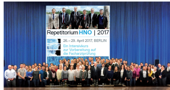
Teilnehmer des Repetitoriums HNO 2017 in Berlin

Die Teilnehmer erhalten einen Online-Zugriff auf ausgewählte Artikel der Rubrik Facharztwissen HNO der Zeitschrift Laryngo-Rhino-Otologie (LRO) des Georg Thieme Verlages